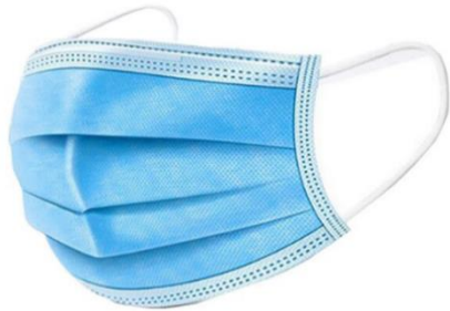
Masque de procédure

*Afin d'alléger le texte, le terme « masque » désigne ces deux (2) types de masques :